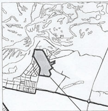
границы испрашиваемой территории